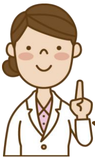
嘱託医 キャナルコート 歯科クリニック 歯科医